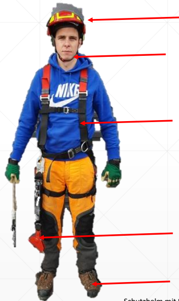
Schutzhelm mit Schutzbrille und Visier